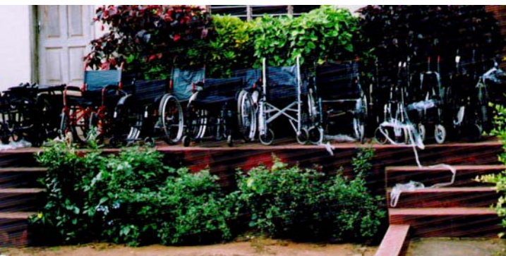
Don de l'APEFE

Cet important appui en matériels roulants, va soulager un tant soit peu les besoins des bénéficiaires de nos différents programmes.