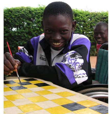
Atelier de peinture

Vivement que pour l'année 2011, nous puissions mobiliser les ressources matérielles et financières pour des Vacances intégratrices