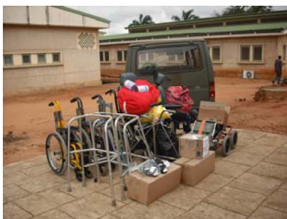
Don de l'Association BASE

L'Association Française Base a fait don de matériels de rééducation, de déambulateurs, de poussettes pour bébé et de fauteuils roulants au mois d'octobre 2009 à l'ONG Equilibre Bénin