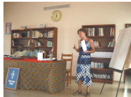
Les animateurs de la journée d'échanges

Précoce du Handicap » et d'autre part de faire ressortir les insuffisances afin d'outiller le personnel de santé pour une meilleure prise en charge précoce