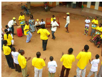
Animation pendant les Vacances Intégratrices