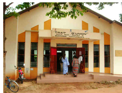
Bibliothèque communautaire Trait d'Union.

Bon vent à toute l'équipe de la bibliothèque !